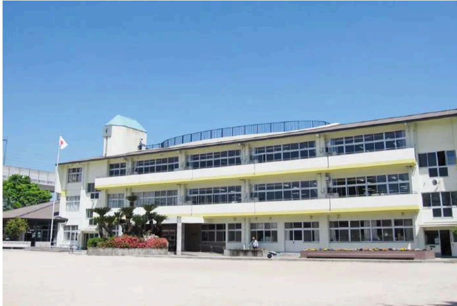
羽犬塚小学校の外観